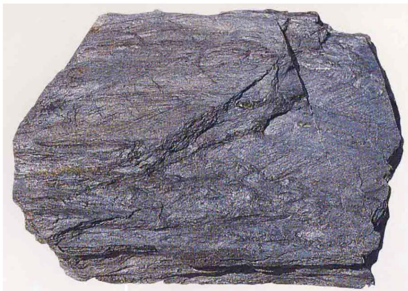
図2 黒雲母片岩帯の泥質片岩